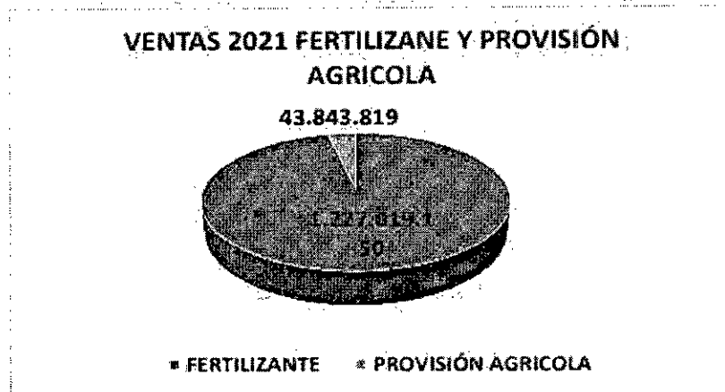
Gráfico ventas de fertilizantes año 2021.

Para los periodos de enero a mayo de 2022 el comportamiento decreciente de la venta de fertilizantes de COOPCAFITOLIMA obedece a factores tales como la falta de capital de trabajo para adquirir fertilizante, el cupo limitado de créditos con los diferentes proveedores del departamento y los escasos de materia prima a nivel mundial de los grados simples de la Urea y Dap, productos fundamentales para la elaboración de mezclas; lo que generó un alza en los precios de los fertilizantes. El aliado comercial más importante para este proceso de comercialización de fertilizantes ha sido Agroinsumos del café S.A. con el aval del Comité de Departamental de Cafeteros del Tolima..."